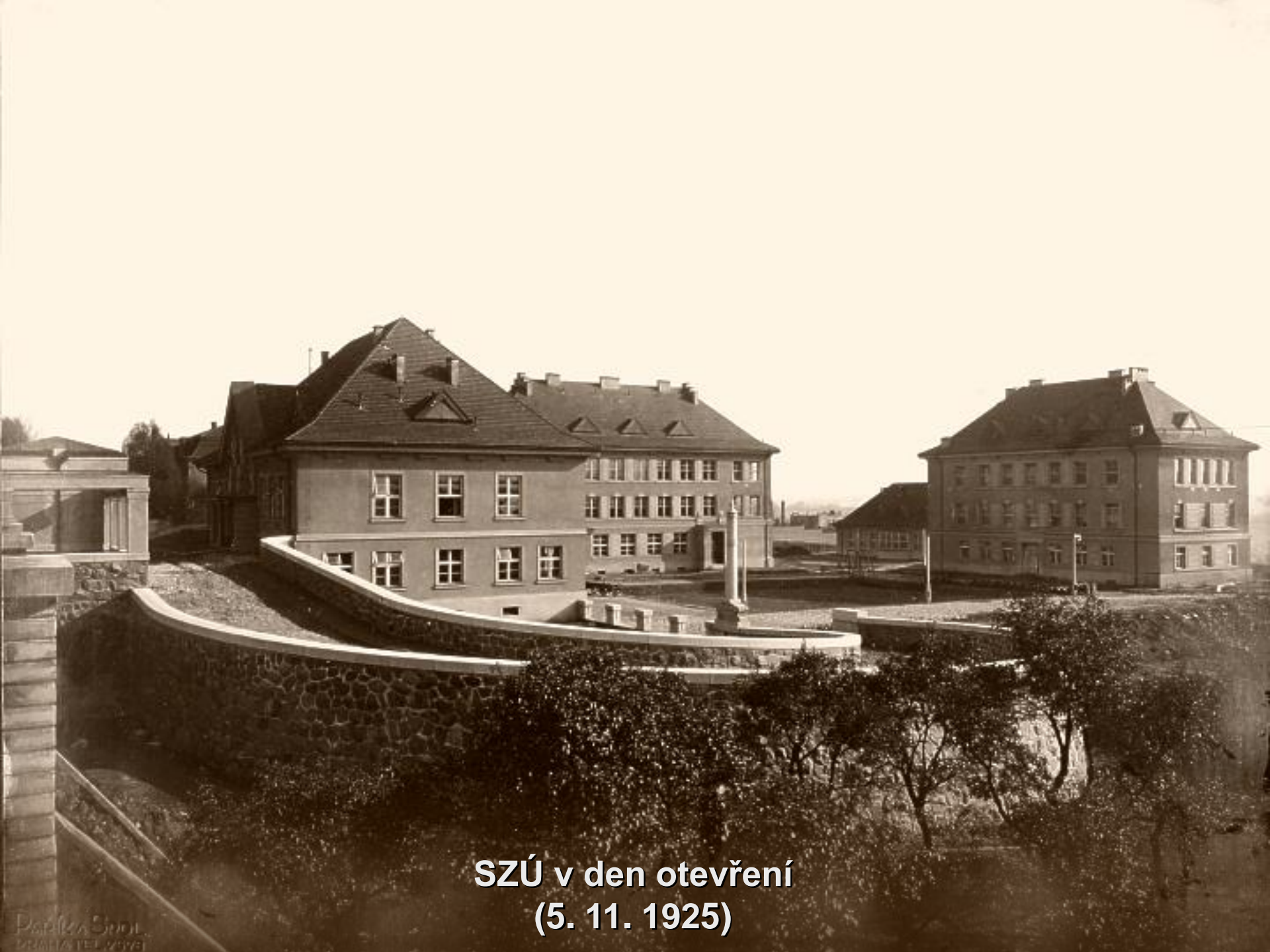
SZÚ v den otevření (5. 11. 1925)